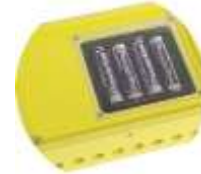
Coupleur de piles