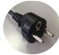
Secteur EDF Batterie

Alimenter : Fourniture de l'énergie nécessaire au système pour réaliser l'action recherchée ( piles, réseau 230V,... )