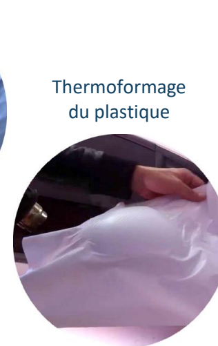
Thermoformage du plastique