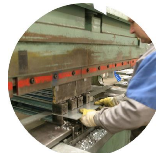
Le cisailage de l'acier