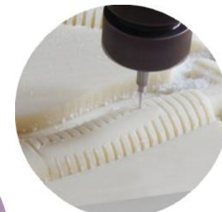
Usinage matériau composite