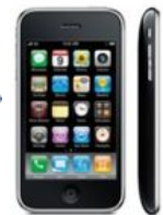
2007 Téléphone intelligent

Les objets évoluent. On compare leur évolution en observant leurs différences . On commente ces différences en les reliant à différents points de vue : fonctionnel, structurel, environnemental, scientifique, technique, social, historique, économique .