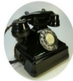
1940 Téléphone à cadran