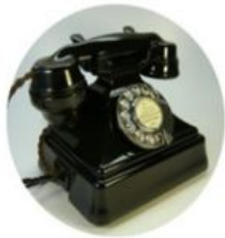
1940 Téléphone à cadran