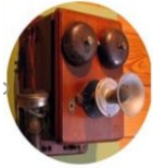
1876 Téléphone intelligent

Les objets techniques évoluent dans le temps. Afin de les comparer et ainsi comprendre leur évolution , on peut se placer suivant différents points de vue .