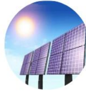
Le solaire (rayonnement ou chaleur)