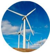
La force du vent (éolienne)