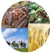
La biomasse (composants ou déchets d'origine animale ou végétale)