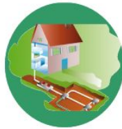
La chaleur de la terre (géothermie)