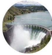
La force de l'eau (hydraulique)