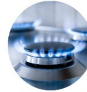
Le gaz naturel