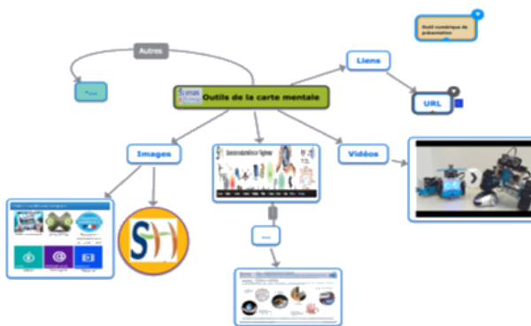
La carte mentale (ou heuristique)