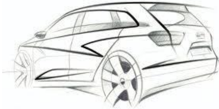
Exemple de croquis d'une nouvelle automobile

Pour imaginer, communiquer, comprendre, expliquer le fonctionnement d'un objet technique, pour le fabriquer, on a besoin de le représenter. La plupart de ces représentations graphiques sont définies par des règles précises (normes) communes à tous les techniciens.