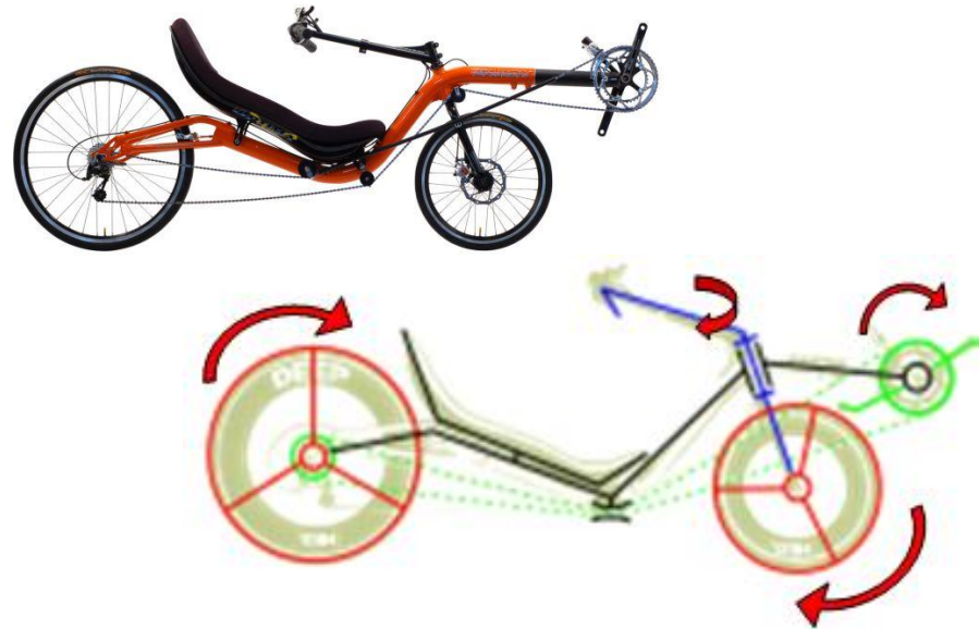
Exemple de schéma d'un vélo couché