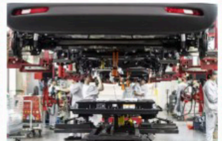
Sur la chaîne de montage de l'usine Leapmotor, constructeur de véhicules électriques, à Jinhua (province de Zhejiang), en Chine, le 23 juin 2024.

Le protectionnisme consiste à protéger un marché national en mettant en place des barrières tarifaires ou non tarifaires. Les membres de l'UE se sont mis d'accord pour mettre en place des droits de douane sur les véhicules électriques chinois afin d'en limiter les importations et de soutenir la transformation de l'industrie automobile européenne qui emploie 13 millions de personnes. Cette mesure va faire augmenter le prix des voitures chinoises de plus de 35%.