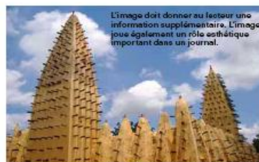
La légende est une note explicative qui accompagne une image

Vient ensuite le contenu de l'article. Vient ensuite le contenu de l'article. Vient ensuite le contenu de l'article.