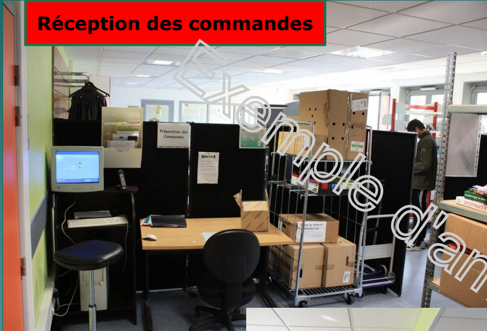
Réception des commandes