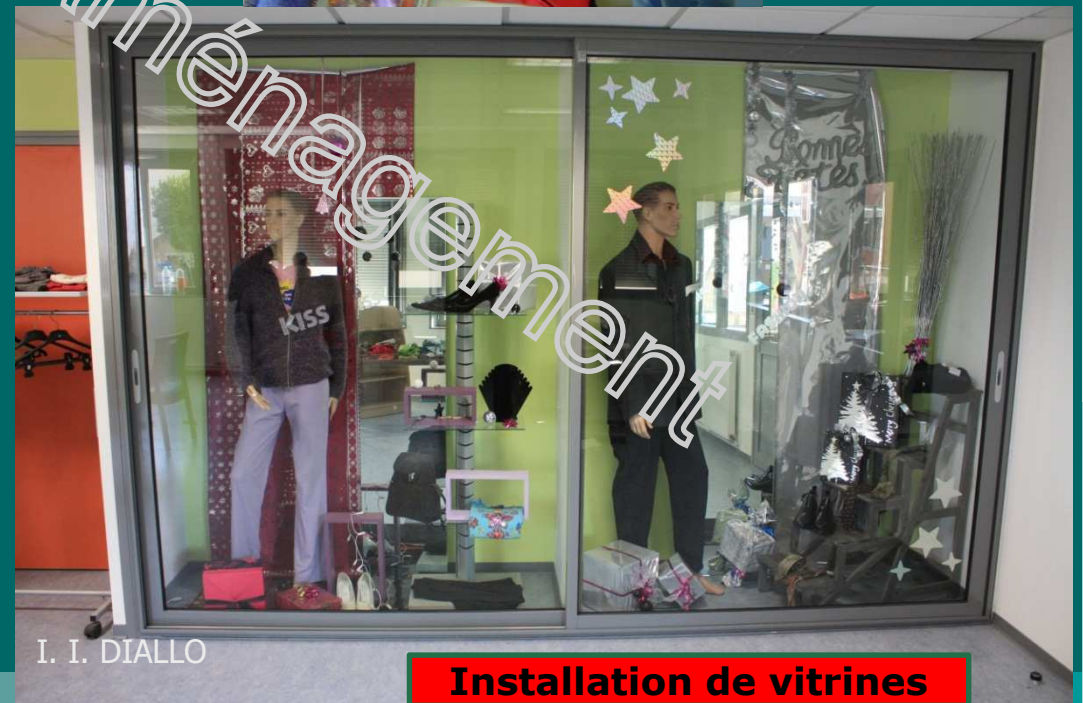
Installation de vitrines