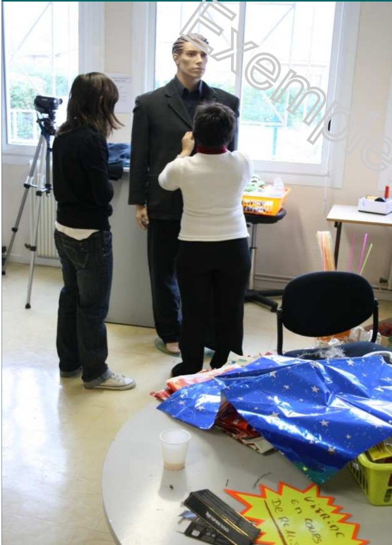
Préparation des mannequins

... qui permet aux élèves de faire travailler leur imagination