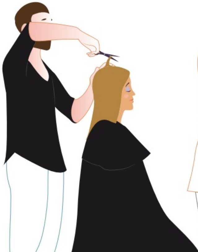
Ciseaux avec anneaux