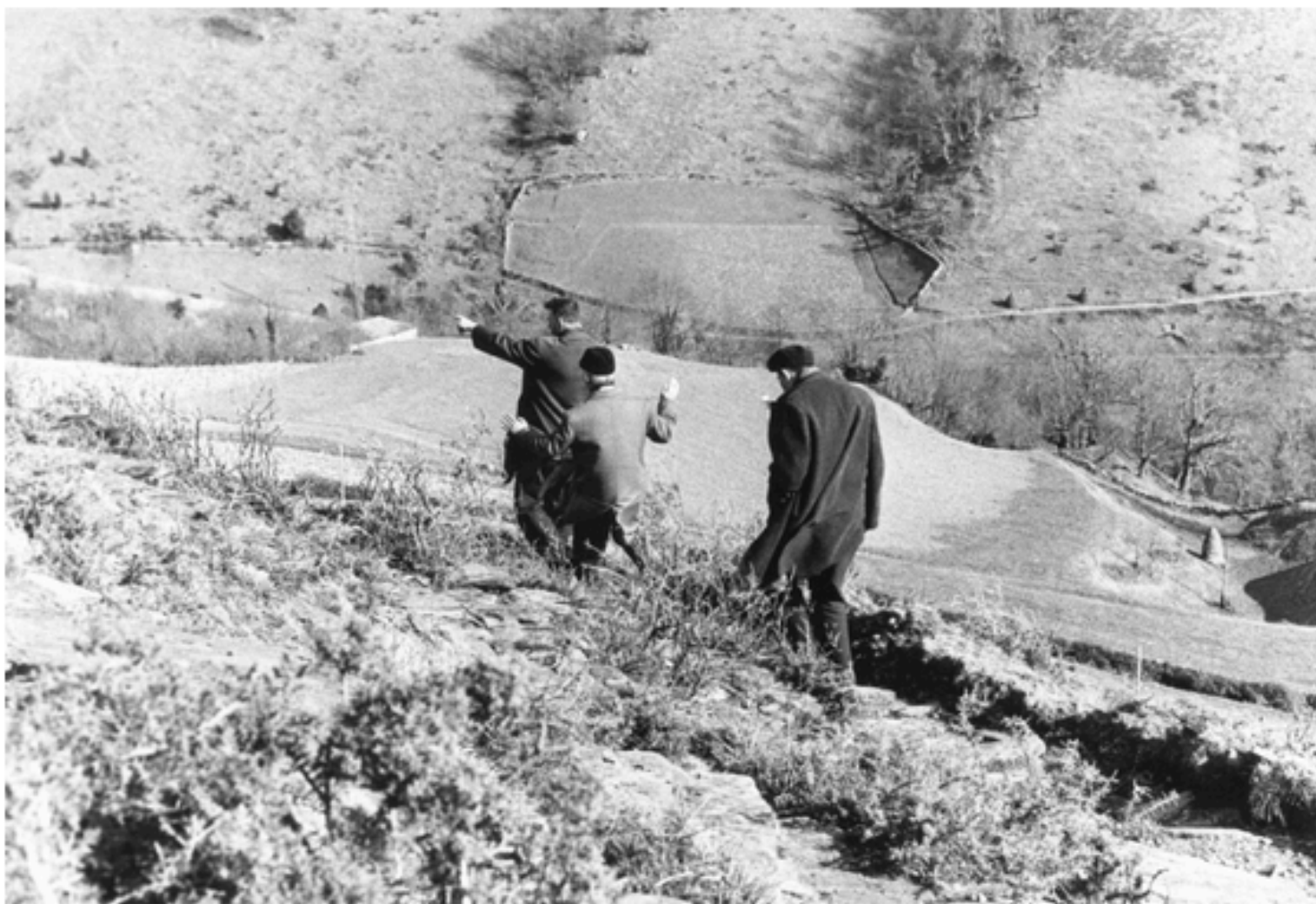
Passage d'immigrés portugais clandestins dans les Pyrénées en mars 1965