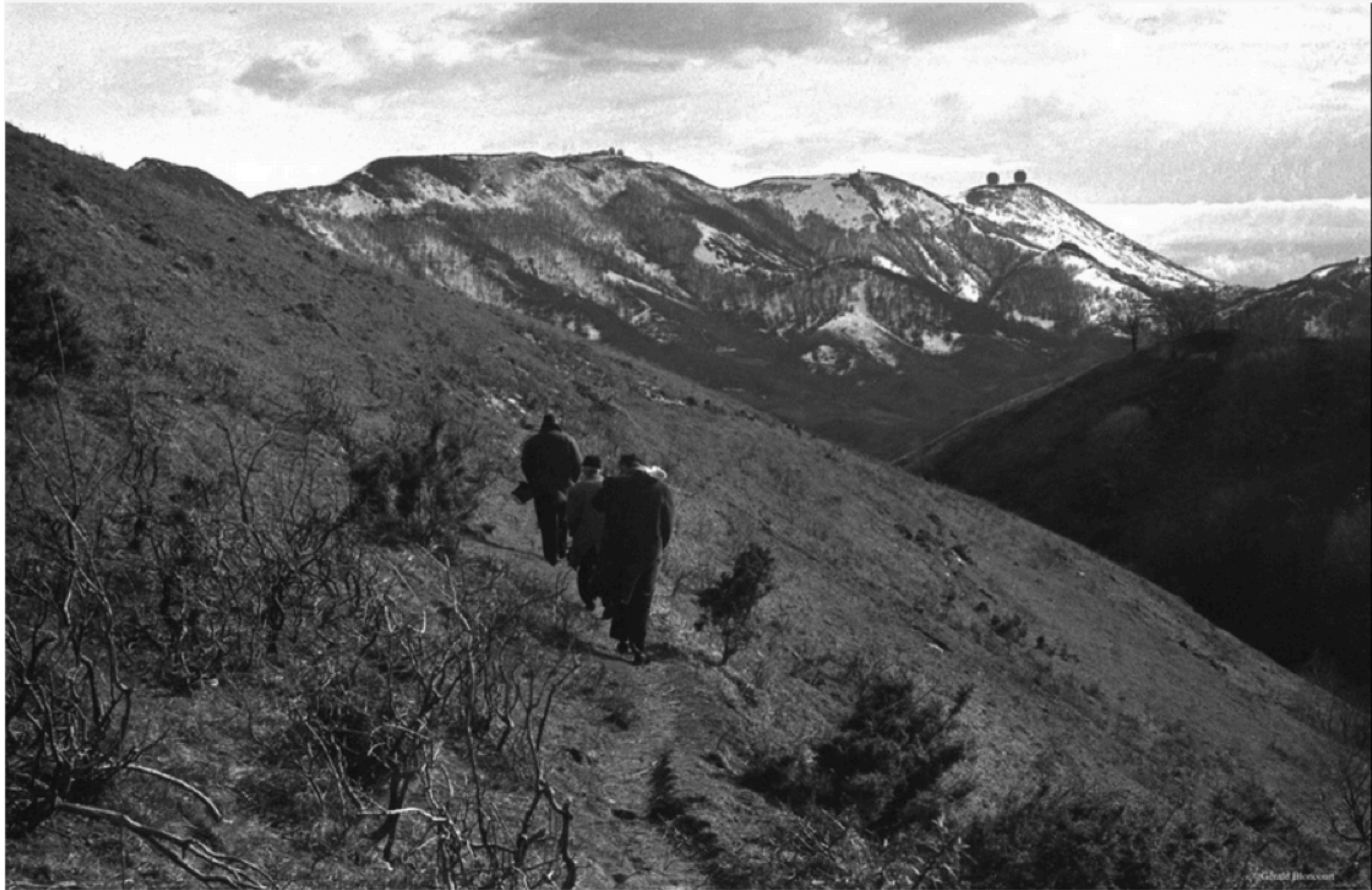
1097/14a- passage clandestin d'immigrés portugais à travers les Pyrénées - mars 1965