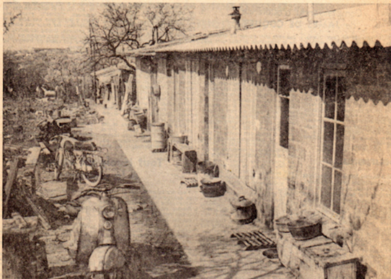
Un poste d'eau pour dix mille personnes, pas de ramassage des ordures, aucun sanitaire, telle est la situation dans le bidonville de Champigny-sur-Marne. Voici une vue très partielle de ce hideux village où sont « parqués » les ouvriers portugais venus travailler dans notre pays.

PRÈS DE 10.000 PERSONNES « PARQUÉES » SANS LA MOINDRE HYGIÈNE