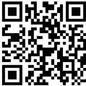
Onisep Technicien / technicienne en optique de précision