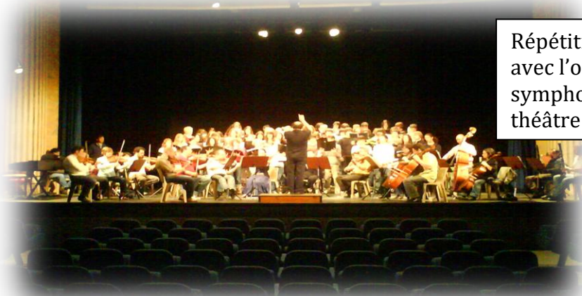
Répétition du chœur du lycée avec l'orchestre des symphonistes d'Aquitaine au théâtre Comoedia de Marmande

Un élève dans le Marmandais peut donc pratiquer la musique à haute dose s'il le souhaite depuis le CE 1 jusqu'à la terminale, avec à la clé de nombreuses expériences et émotions.