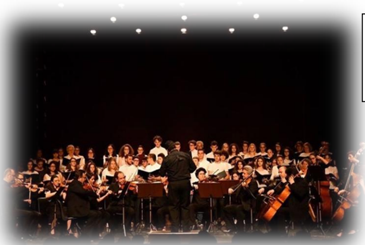
Concert du chœur du lycée avec l'orchestre des symphonistes d'Aquitaine au théâtre Comoedia de Marmande