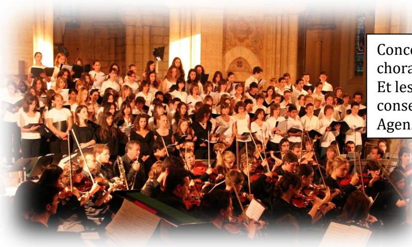
Concert à Agen rencontre chorale entre les lycées et cham Et les orchestres des conservatoires de Marmande et Agen.