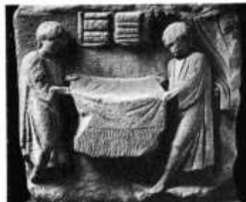
Excavating cloth. Relief from near St. Wundt (Germany).