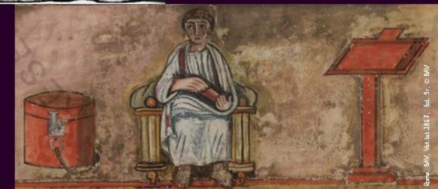
Bas-relief, Musée de la Ville de Bayeux

15 conférences sur la Littérature, l'Histoire et les Arts, ouvertes à tous