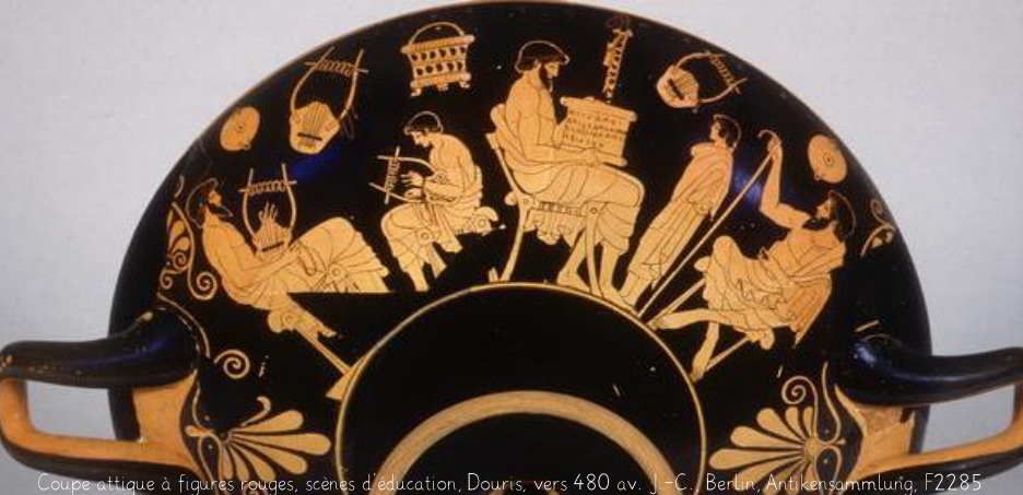
Coupe attique à figures rouges, scènes d'éducation, Douris, vers 480 av. J.-C., Berlin, Antikensammlung, F2285