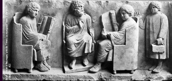
Bas-relief avec à l'horizontale : Praxède, Trèves, un enseignement avec 3 disciples (1835-40)

Mardi 7 13h30-17h Mercredi 8 9h-17h30 Avril 2020