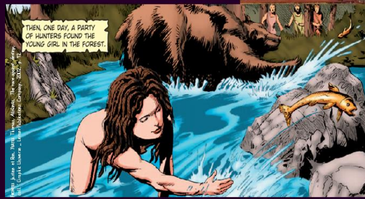
Illustration de la scène de la forêt, dans le roman 'Le monde grec-romain' de l'éditeur L'Érudition, collection 'Le monde grec-romain', 2017, p. 112

Plus d'infos : https://alter.univ-pau.fr