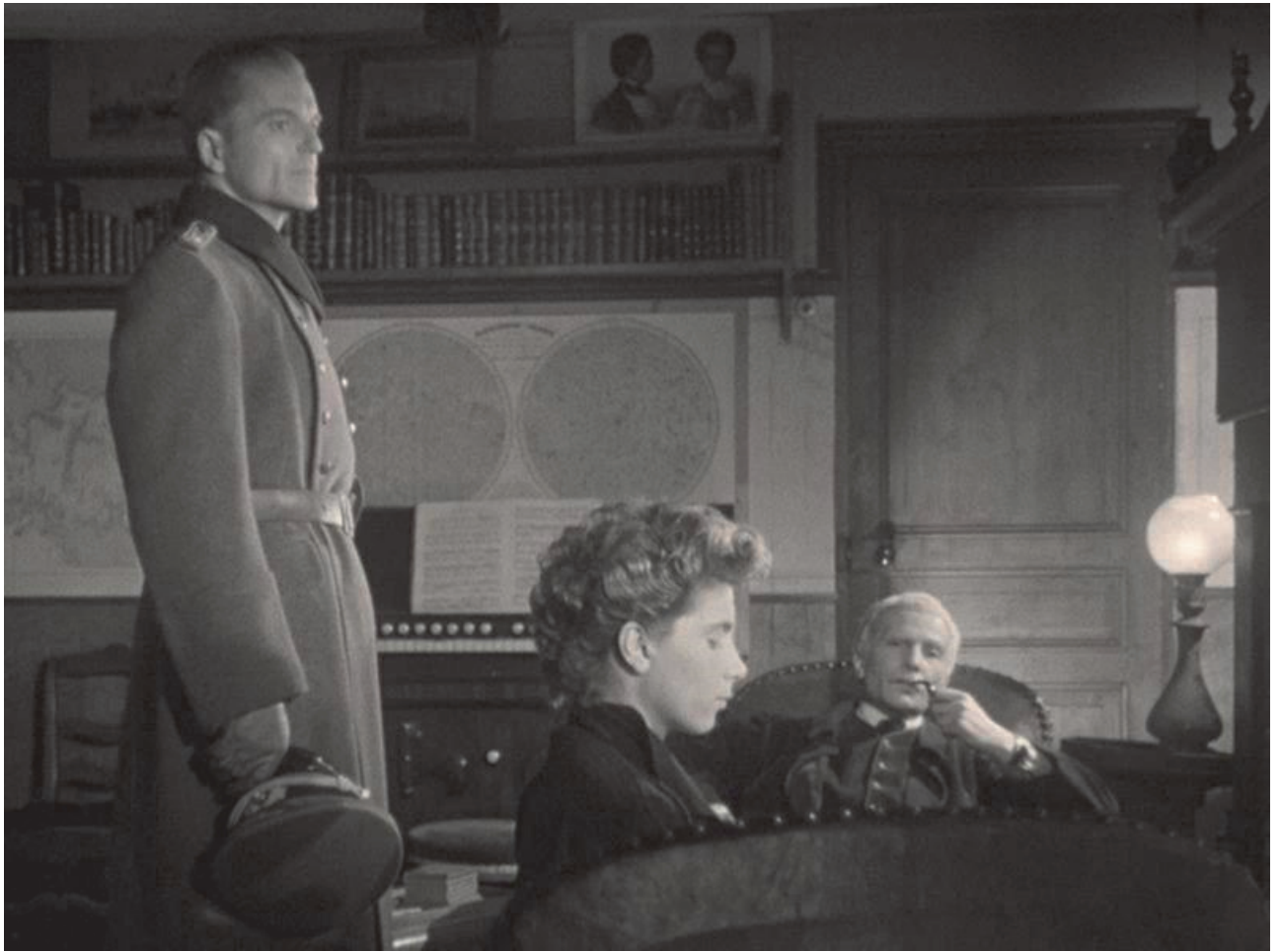
Le silence de la mer , film de Jean-Pierre Melville, tourné en 1947 et sorti en 1949. D'après la nouvelle de Vercors.