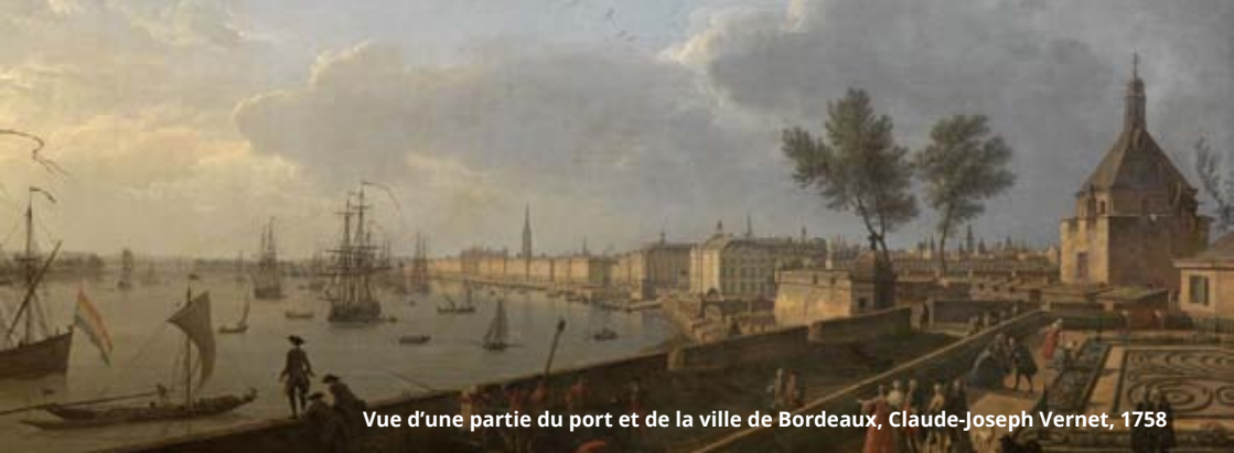
Vue d'une partie du port et de la ville de Bordeaux, Claude-Joseph Vernet, 1758