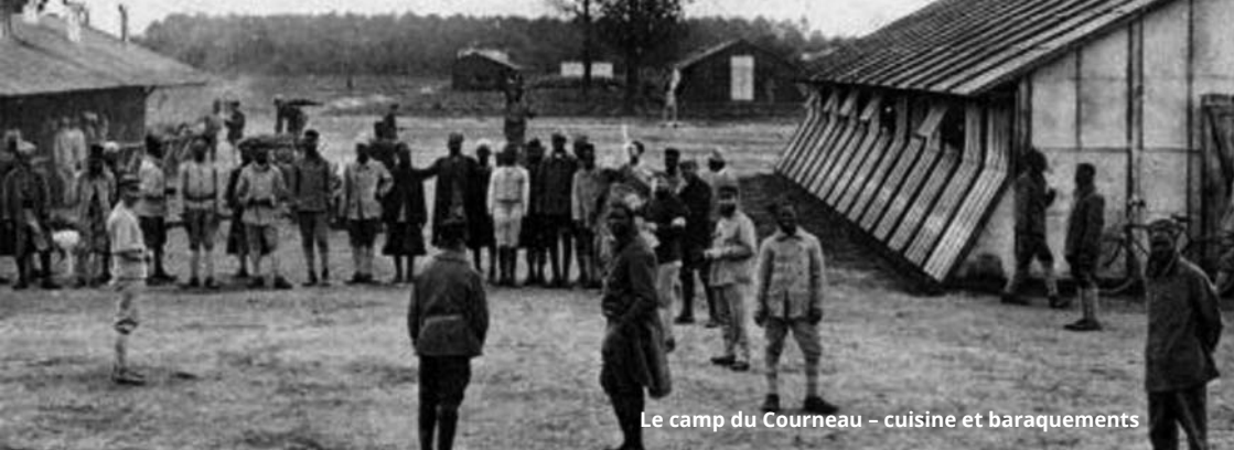
Le camp du Courneau – cuisine et baraquements