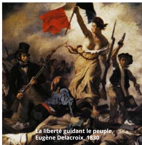
La liberté guidant le peuple, Eugène Delacroix, 1830

La révolution française de 1789 marque l'avènement de la République. Les Français, jusqu'alors « sujets » du Roi (régime monarchique), deviennent des citoyens* libres à travers la proclamation de la Charte de Droits de l'Homme et du Citoyen. C'est à cette époque qu'apparaît pour la première fois notre devise républicaine, que l'on peut voir sur tous les frontons des écoles et mairies : liberté, égalité, fraternité. Ce ne sont pas que des mots, ce sont les valeurs* qui guident la république française.