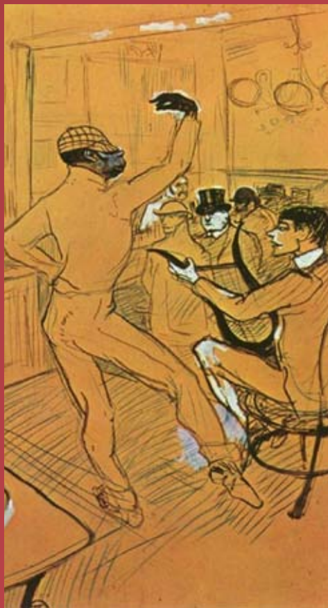
Le clown Chocolat par Toulouse-Lautrec, 1896

L'aventure des deux complices durera jusqu'en 1910, date de leur séparation. Par la suite, Rafael tentera de nouveaux spectacles, sans succès. Il décédera en 1917, oublié et tombé dans la misère. Il est enterré à Bordeaux.