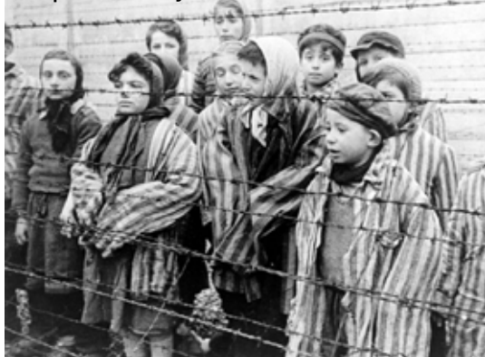
Des enfants rescapés lors de la libération du camp d'Auschwitz. Janvier 1945.

Aujourd'hui encore d'autres formes de domination et d'exploitation de l'Homme (esclavage moderne) persistent bien qu'elles soient interdites par la loi.