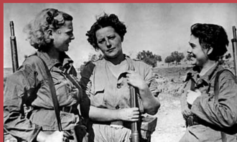
Miliciennes républicaines sur le front d'Aragon, Agosto Centelles, en 1936

Jalles. Sous le régime de Vichy, et dans l'idée qu'après la libération de la France viendra celle de l'Espagne, de nombreux espagnols s'engagent dans la résistance. Ainsi, parmi ceux réquisitionnés pour participer à la construction de la Base sous-marine de Bordeaux alors dirigée par les Allemands, un certain nombre va organiser des sabotages au sein même du bâtiment pour ralentir l'effort de guerre des Allemands. Plus largement, de nombreux républicains espagnols intègrent les troupes de la France Libre et des réseaux clandestins de résistance.