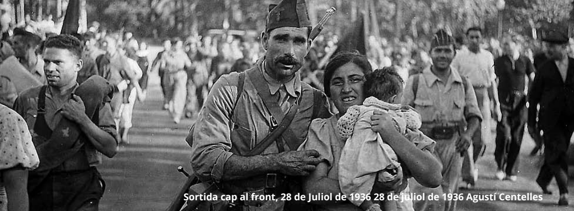
Sortida cap al front, 28 de Juliol de 1936 28 de Juliol de 1936 Agustí Centelles