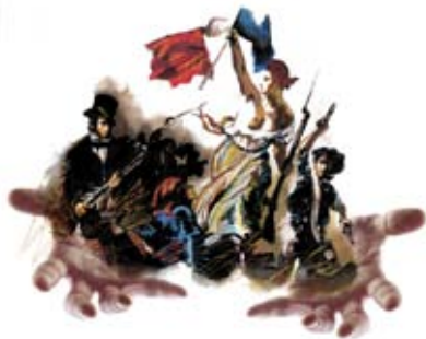
Illustration © F. Ben Mansour

Il s'adresse aux scolaires, inscrits dans des établissements publics ou privés ou des associations complémentaires de l'école. Les participants peuvent s'inscrire soit individuellement par eux-mêmes, soit collectivement par l'intermédiaire d'un éducateur référent (ou tout autre responsable adulte des structures participantes).