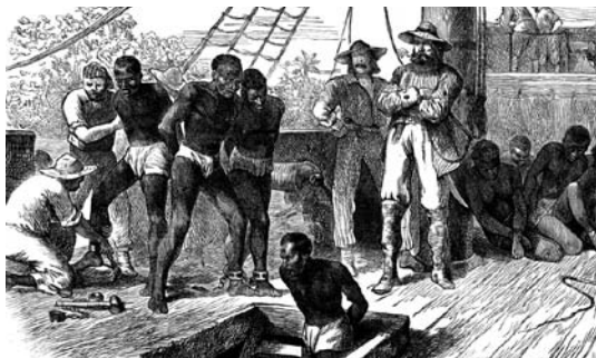
La traite des Noirs, gravure d'époque

en 1848 alors que le Brésil est le dernier pays à avoir aboli l'esclavage en 1888.