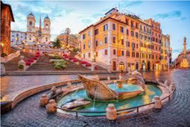
Fontana della barcaccia - PIAZZA NAVONA - ROMA

BELLISSIME CITTÀ : Il week end ho visitato delle città come Roma, Bologna, Venezia, Firenze, o il mare e la montagna.