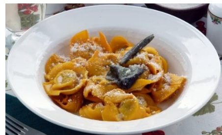
I ravioli di zucca, specialità di Ferrara!