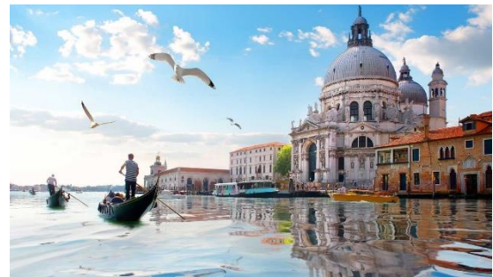
VENEZIA - CHE CITTÀ STRAORDINARIA!!!

In Francia ero al liceo con il mio corrispondente tutta la giornata ma il week-end e il mercoledì l'ho portato al mare, alla Dune du Pilat, a Bordeaux, a Tolosa e anche a Parigi !!!