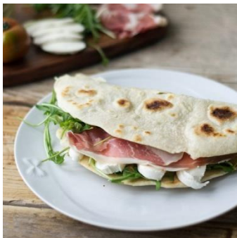
La piadina romagnola

La famille de mon correspondant a été très gentille avec moi (je suis devenue très amie avec les petits frères de mes deux correspondants ) et je peux