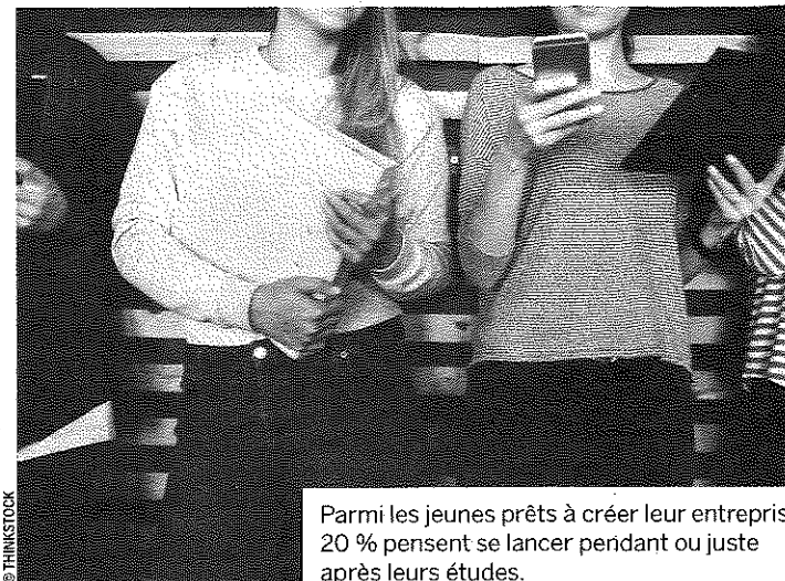
Parmi les jeunes prêts à créer leur entreprise, 20 % pensent se lancer pendant ou juste après leurs études.

notamment le fait de pouvoir être libres de leurs décisions (motivation importante et assez importante pour 87 %)", relèvent les auteurs de l'étude.