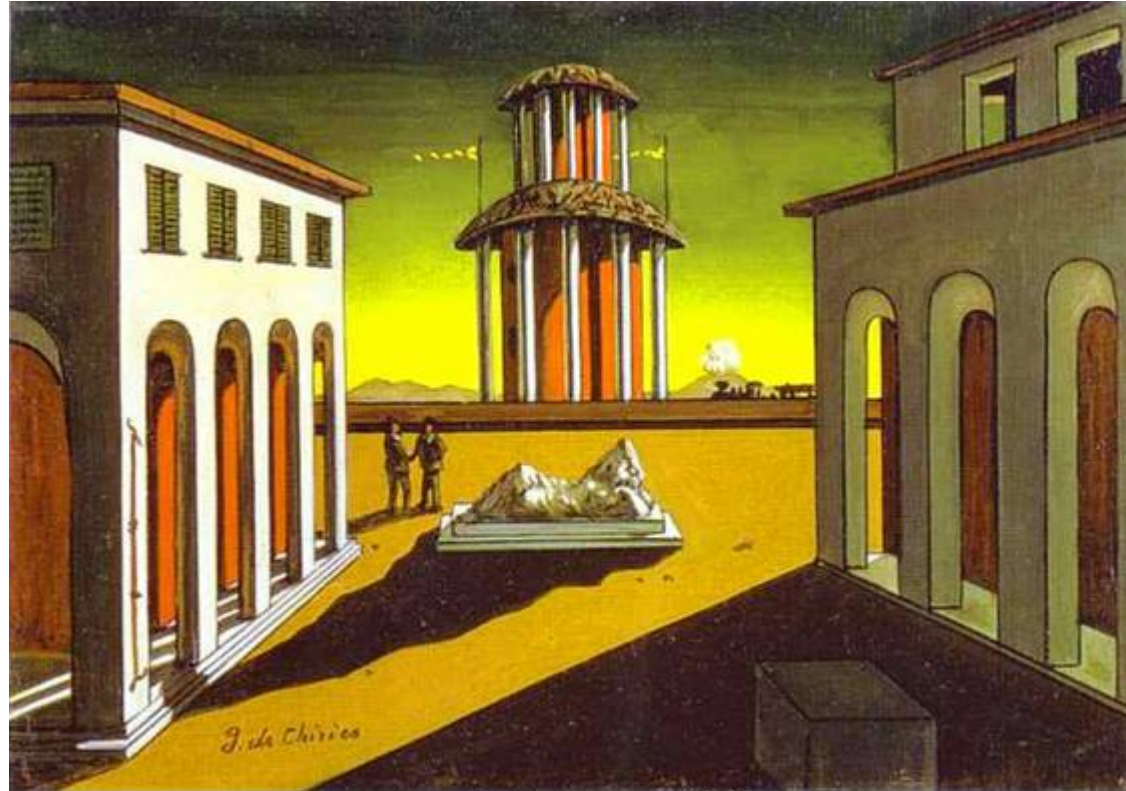
Giorgio de Chirico - Piazza d'Italia