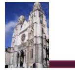
Église St Jacques