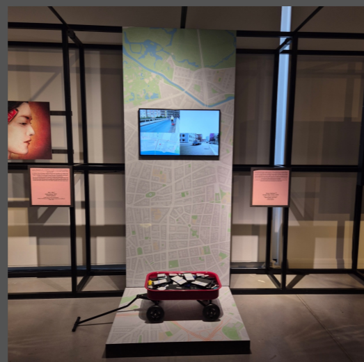
Simon WECKERT , Google maps Hacks , 2020