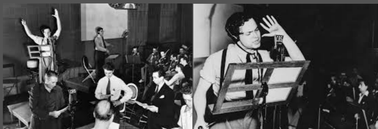
Orson Wells , La Guerre des mondes , adaptation du roman du même nom de l'écrivain H. G. Wells, interprétée par la troupe du Mercury Theatre, diffusée le 30 octobre 1938 sur le réseau CBS aux États-Unis.