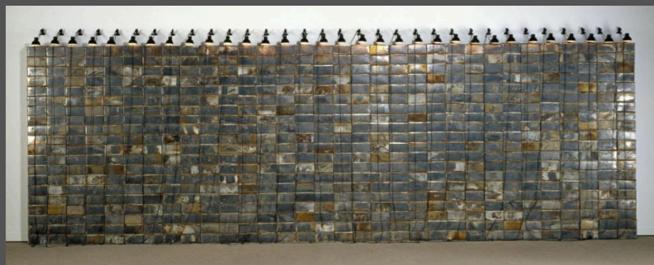
Christian BOLTANSKI , Les Archives , 1965, installation, Les dimensions totales de l'installation sont variables, chaque boîte : 12 x 23,4 x 21,8 cm.