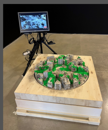
Alain JOUSSEAU , G255 , 2020, Fondation EDF, exposition Fake news , du 27 mai 2021 au 30 janvier 2022.