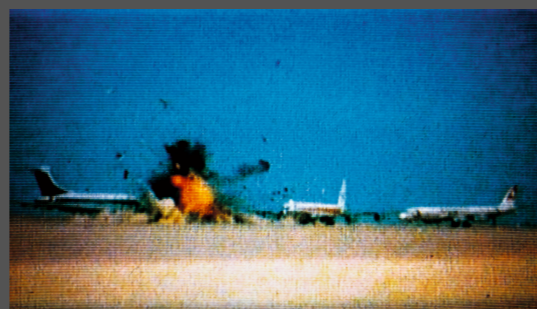
Johan GRIMOMPRES , dial H-I-S-T-O-R-Y , film de 68 minutes, 1997, coproduction du Centre Pompidou et participation de la Documenta X