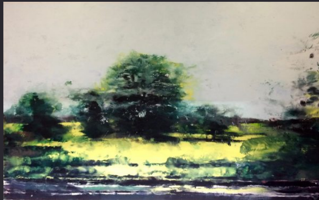
Philippe Cognée , Paysage, Vue d'un train , 2013, huile sur toile, 175 x 280 cm.