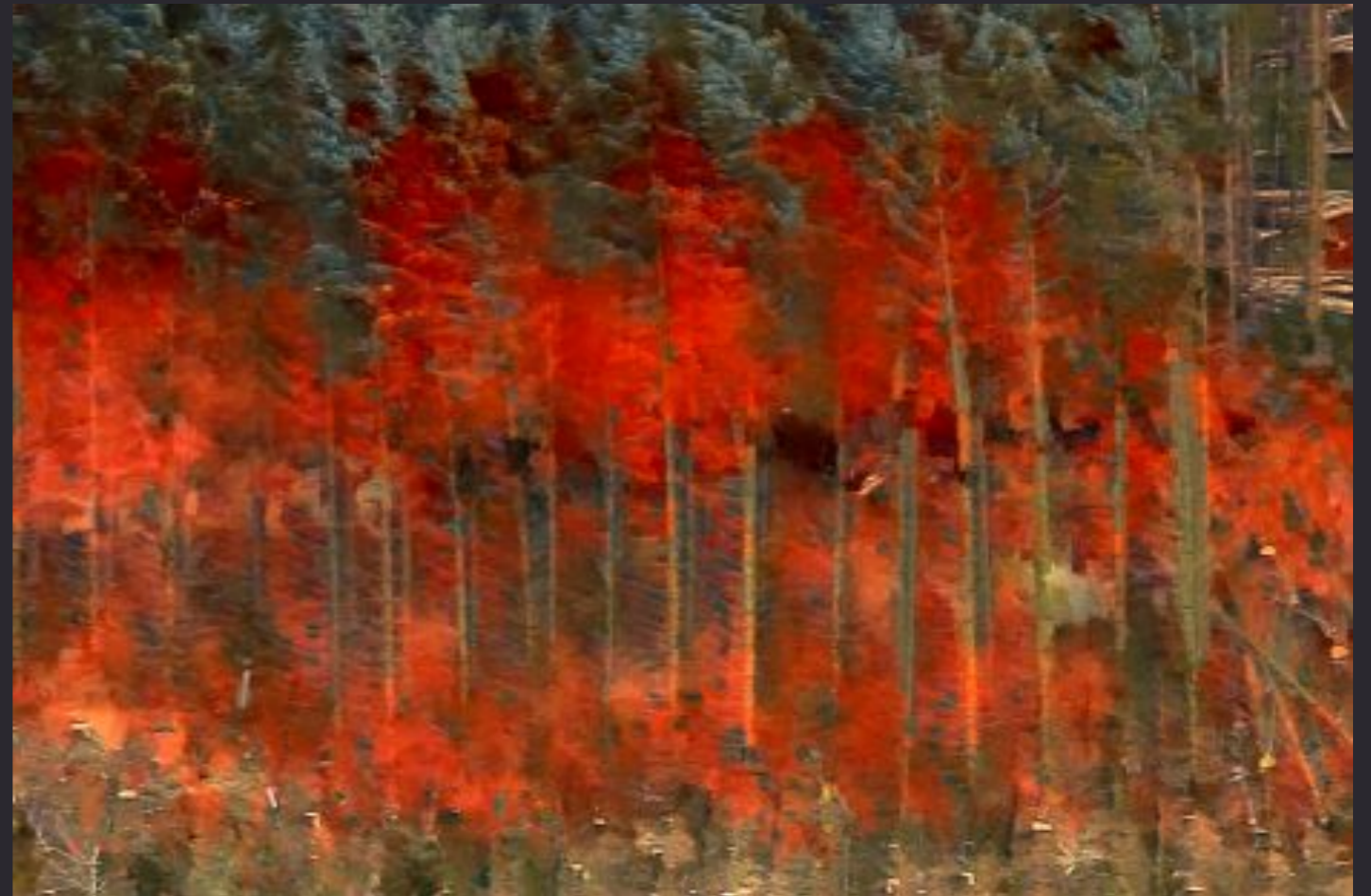
Jacques Perconte , Ettick , 2015, film de 57 minutes

Cliquez sur certaines images ou cartels !