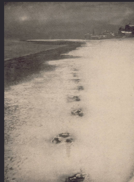
Robert Demachy , Paysage , 1904, simligravure, épreuve photomécanique, 21,2 x 15,08 cm, Musée d'Orsay.

Cliquez sur certaines images ou cartels !