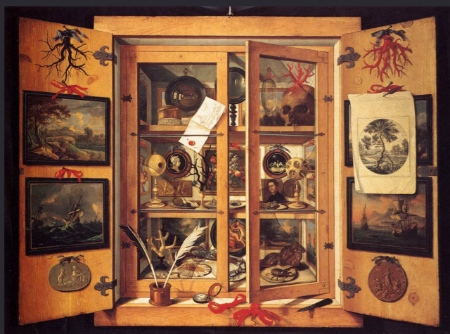
Dominico Remps , Cabinet de curiosités , 1790, 99 x 137 cm, Musée de l'office de la pierre dure, Florence.,