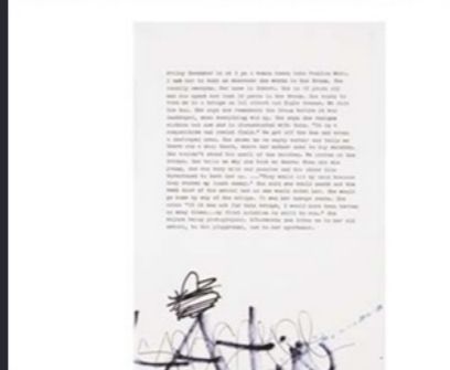
Sophie Calle , The Bronx , 2002, photographie, 30,5 x 24,8 cm, Artothèque de Pessac.