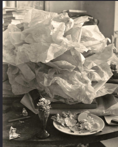
Joseph Sudek , Labyrinthe sur ma table , 1967, Epreuve gélatino-argentique, 27,7 x 24,4 cm, Jeu de Paume, Paris