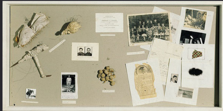
Christian Boltanski , Vitrine de référence , 1971 bois, Plexiglas, photographie, cheveux, tissus, papier, épingle, boulette de terre, fil de fer, 12,4x 120 59,6 cm, Centre Pompidou, Paris.

Un cyanotype réalisé lors de la pratique exploratoire constitue le fragment d'un souvenir dont vous reconstituez l'intégralité en ajoutant au choix des écrits, des dessins, des images, des objets. Vous travaillerez le dispositif de présentation sera en adéquation avec la nature du souvenir.