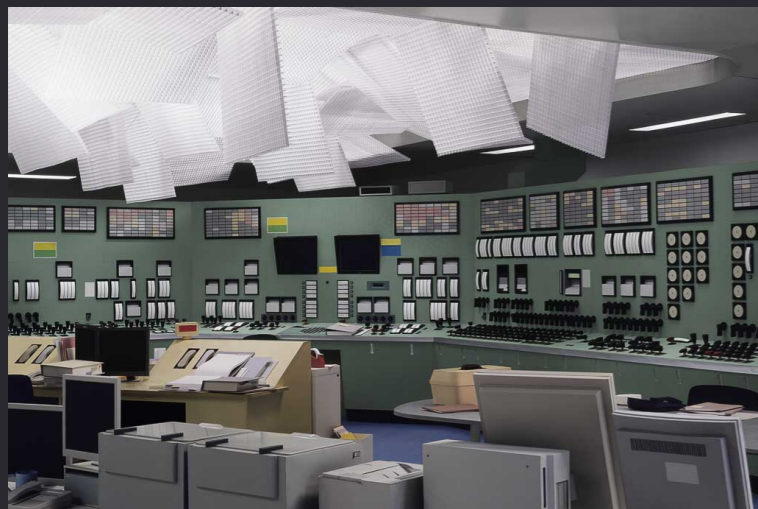
Thomas Demand , Control Room , 2011, C-Print, 2000 x 3000 cm, Jeu de Paume, Paris.