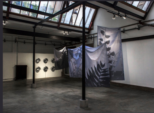
Jonathan Cypres & Cécile Gallo , Tout ce que l'on construit brûle , 2019 dimensions variables, acier, impressions sur tissus, ventilateurs

Cliquez sur certaines images ou cartels !