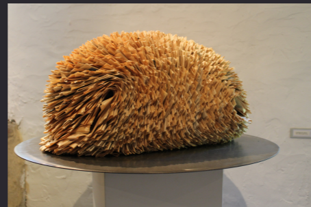
Bernadette Chéné , Un hérisson de papier