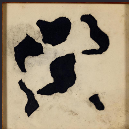
Hans Arp , Papier déchiré, Papiers déchirés et collés sur papier , 14 x 14 cm, Centre Pompidou, Paris