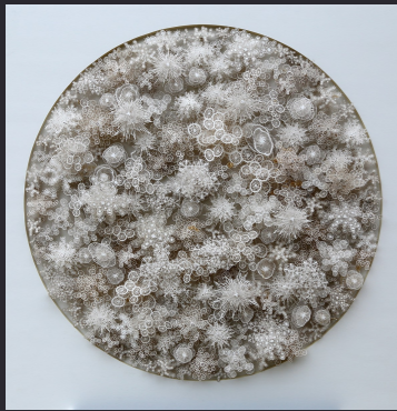
Rogan Brown , Magic Circle, Variation 6 , 2018