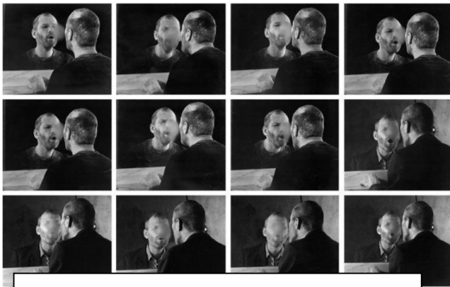
Dieter Appelt , La tache que laisse le souffle sur le miroir , 1977.

"... ce que je nomme mon autoportrait, est composé de milliers de jours de travail. Chacun d'eux correspond au nombre et au moment précis où je me suis arrêté de peindre après une séance de travail. "