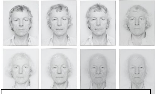
Roman Opalka , Autoportraits , 1965-infini, photographies N&B sur papier, 24x30,5 cm.

"... ce que je nomme mon autoportrait, est composé de milliers de jours de travail. Chacun d'eux correspond au nombre et au moment précis où je me suis arrêté de peindre après une séance de travail. "