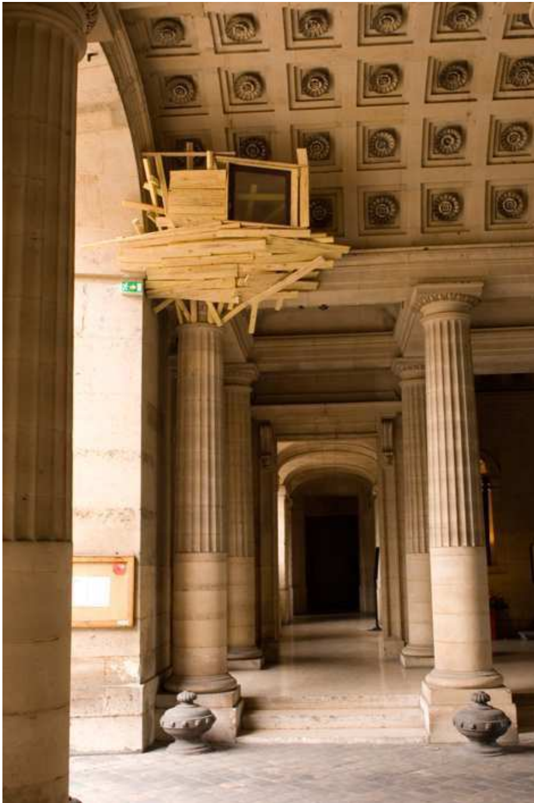
Tadashi, KAWAMATA, Tree Huts , bois, 2008. Installation in situ réalisée dans l'hôtel de la Monnaie, Paris, France.